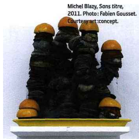
Michel Blazy, Sans titre , 2011.

Michel Blazy, Le Grand Restaurant , du 20 septembre au 18 novembre au Plateau-Frac Ile-de-France, Paris. www.fracidf-leplateau.com