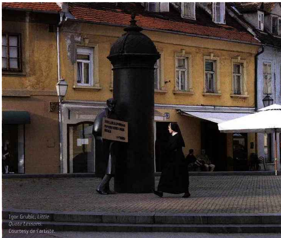
Igor Grubic, Little Quote Lessons .

CRAK , les 27 et 28 septembre à l'Eglise Saint-Merry, Paris. babbelproductions.com/crakfestival.html