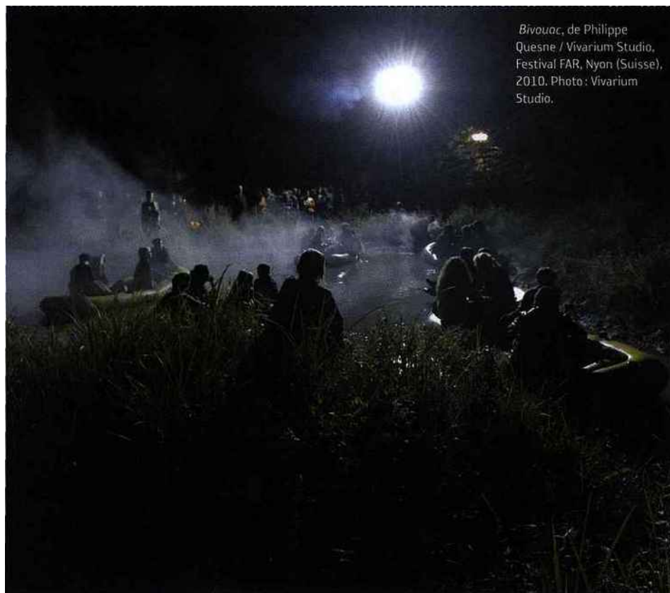
Bivouac , de Philippe Quesne / Vivarium Studio, Festival FAR, Nyon (Suisse), 2010.