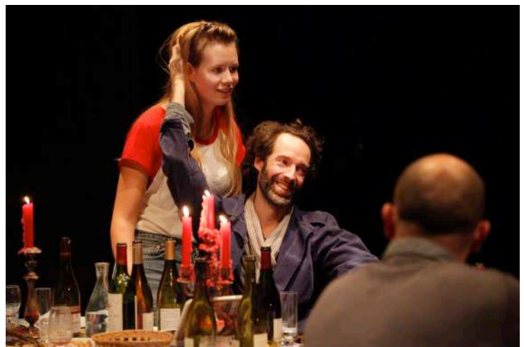
Nous sommes seuls maintenant

Au fil de ce triptyque, les personnages ont traversé des unions, des retrouvailles et des déchirures tandis que s'écoulaient les décennies. Avec Catherine et Christian (fin de partie) , le collectif In Vitro aborde pour la première fois le thème de la mort: le cycle se clôt sur ces premières funérailles, celles de ses héros.