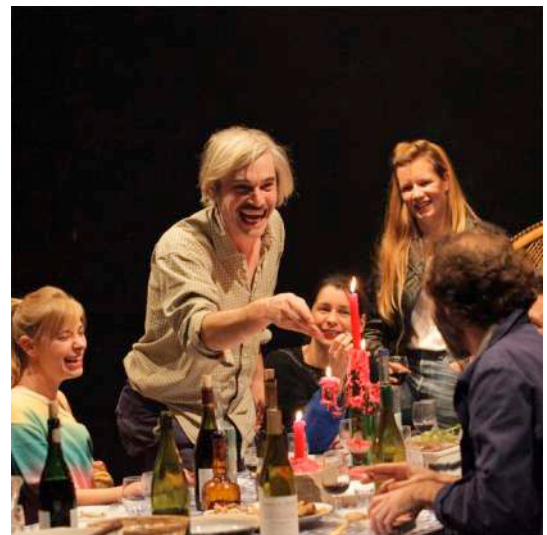
Nous sommes seuls maintenant

Ce travail d'investigation du réel a pour but de retranscrire au plateau cette captation du vivant, de maladresse du direct afin de s'approprier l'espace théâtral et de réduire au maximum la frontière avec le spectateur. L'acteur et le personnage, le texte et l'improvisation cherchent à se ressembler, à se rassembler pour ne faire qu'un. Nous ne cherchons pas la performance. L'acteur accepte de regarder en lui pour regarder les autres, oser chercher les traces de la vie comme un engagement. Nous ne fixons pas un corps théâtral sur un tuteur, nous le laissons monter dans une certaine anarchie naturelle qui tient grâce à son équilibre : le collectif.