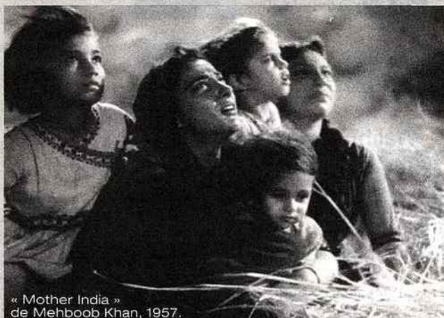
« Mother India » de Mehboob Khan, 1957.

L'Inde est non seulement le plus grand producteur de films au monde mais la réputation de son cinéma s'étend désormais à l'échelle internationale. Le musée Guimet célèbre cette année le centenaire du 7 ème art indien avec