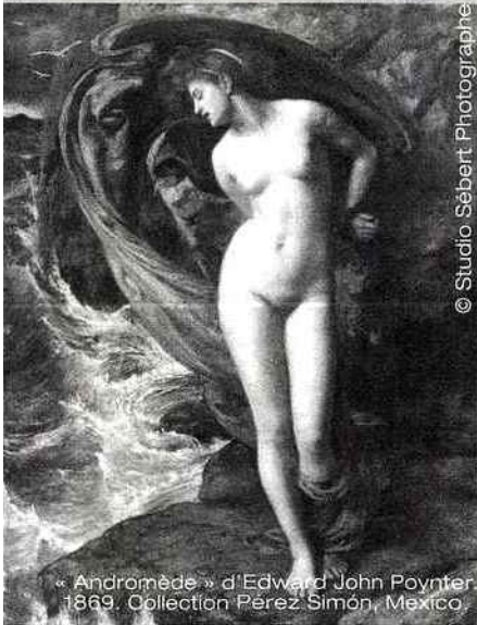
« Andromède » d'Edward John Poynter, 1869. Collection Pérez Simón, Mexico.