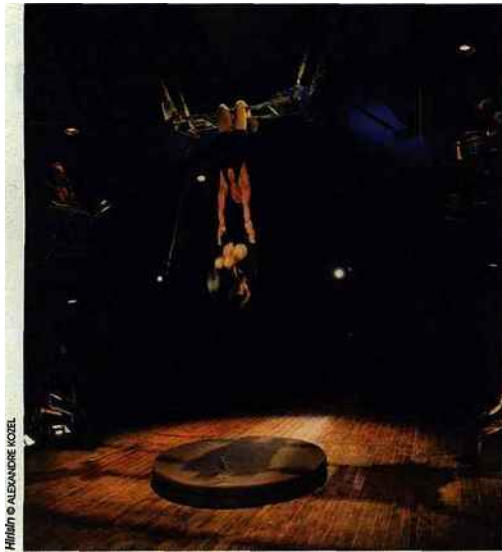
Hirsinn © ALEXANDRE MOCEL