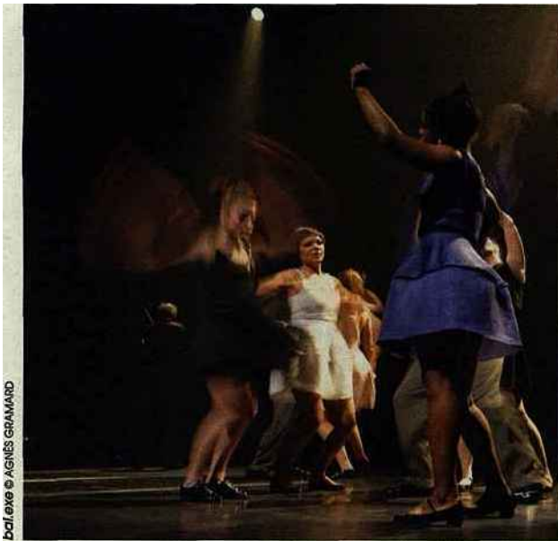
bal.exe © AGNÈS GRAMARD